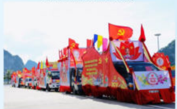
Hình 24d (rước bằng xe)