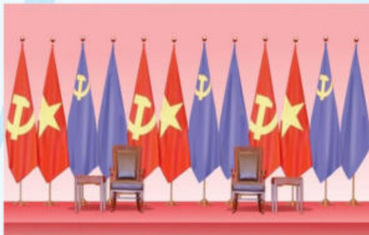
Hình 22 - (2 cờ màu tím là minh họa cờ Đảng và Quốc kỳ nước khách)

Điều 12. Nơi tổ chức các hoạt động đối ngoại đảng, ngoại giao nhà nước