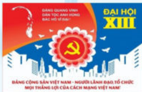
Hình 31b (panô tuyên truyền)