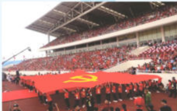
Hình 24a (rước cờ vai)