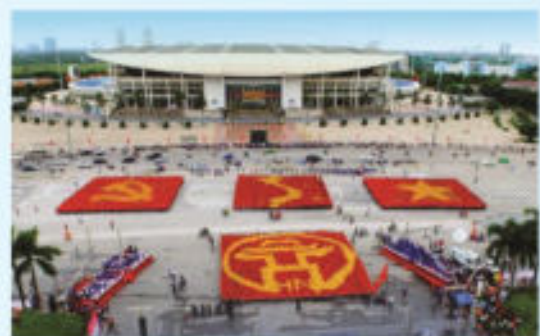
Hình 32 (xếp bằng người)