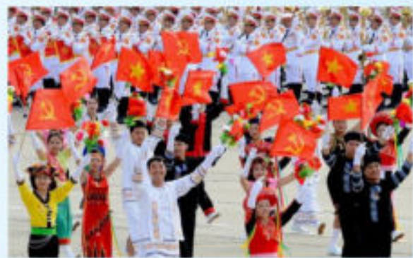
Hình 23d (vẫy bằng tay)