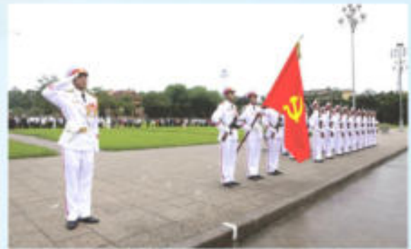
Hình 23b (giương cờ)