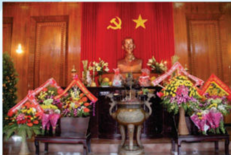
Hình 21c - Trong đền thờ chính

Điều 12. Nơi tổ chức các hoạt động đối ngoại đảng, ngoại giao nhà nước