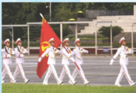
Hình 23c (vác cờ)