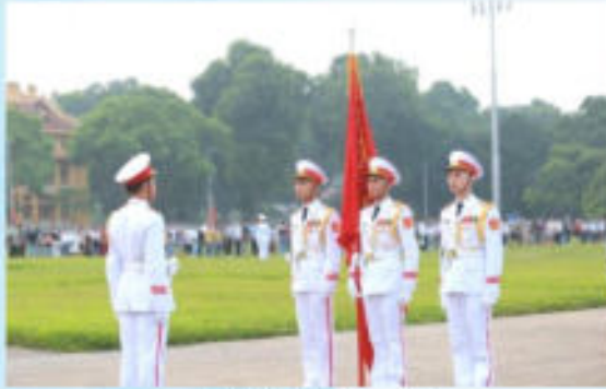
Hình 23a (cầm cờ)

Điều 13. Cầm, rước cờ Đảng khi tổ chức các hoạt động, mít tinh, diễu binh, diễu hành