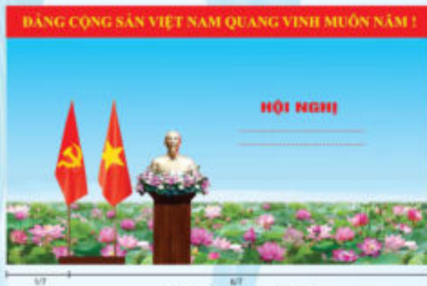
Hình 2 (Cờ có cán)