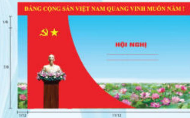
Hình 5b (cờ xếp chéo đơn)