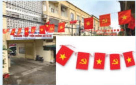
Hình 16b (cờ dây)