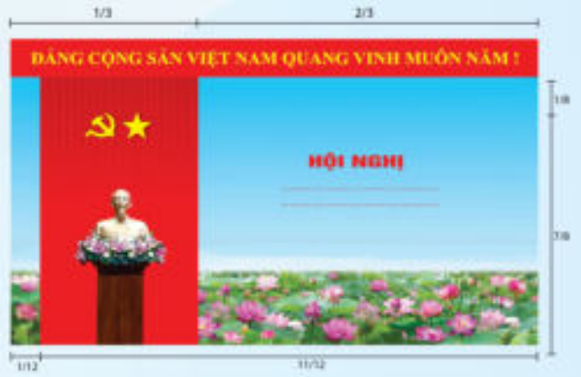
Hình 5a (cờ xếp dọc)