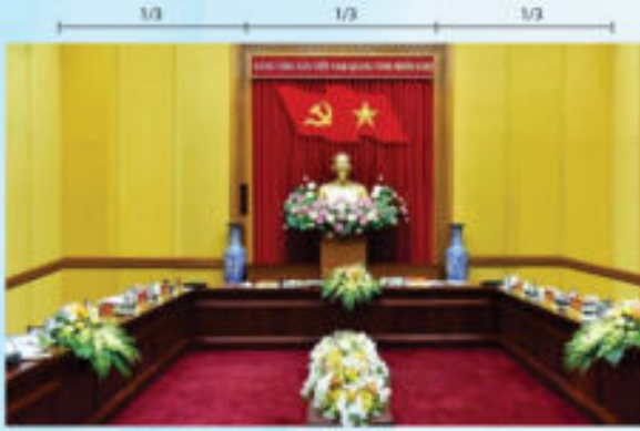
Hình 4b (kích thước hội trường nhỏ)