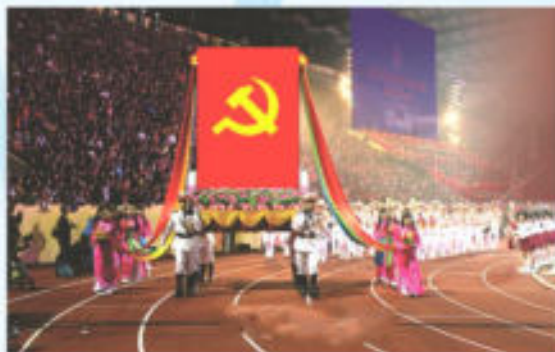
Hình 24c (rước trên kiệu)