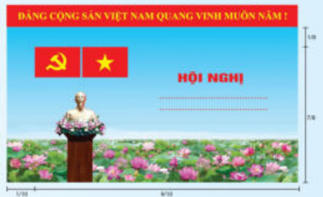
Hình 3a (cờ không tạo sóng)