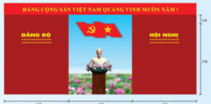
Hình 4a (kích thước hội trường rộng)