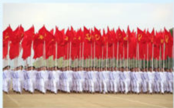
Hình 24b (rước theo hàng)